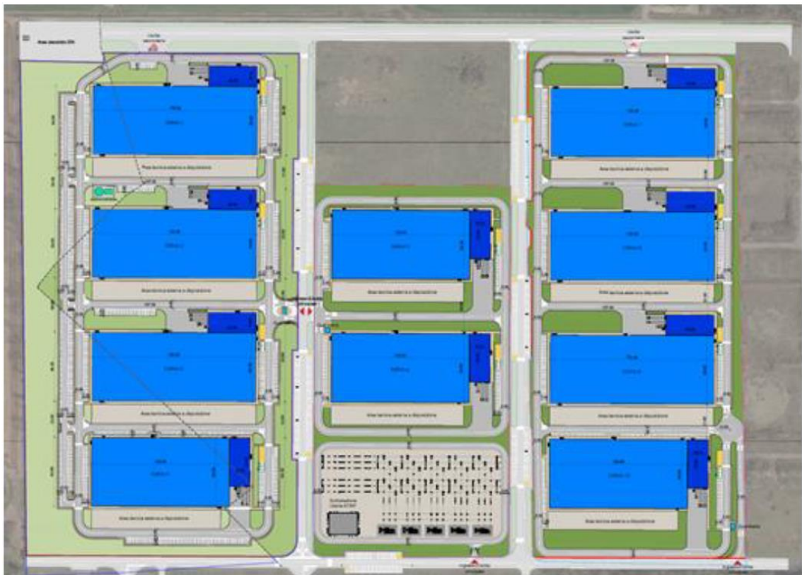
Masterplan del progetto

Di seguito si riporta il masterplan di progetto: